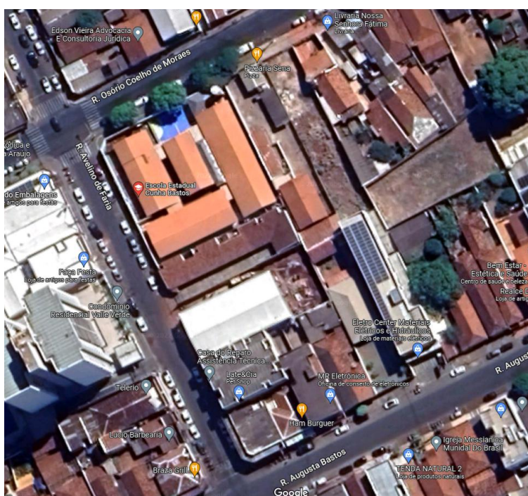
Imagem Aérea